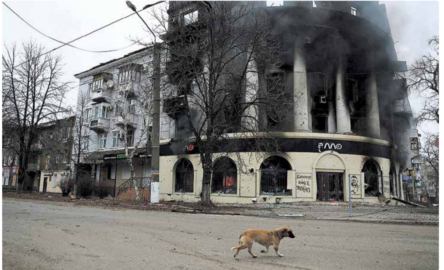
Vene väed jätkavad Bahmuti ründamist.

Lahingut Bahmuti eest peetakse oluliseks proovikiviks Wagneri juhile Jevgeni Prigožinile, kes on värvanud tuhandeid vange, et linn lõplikult okupeerida. Prigožin kritiseeris Venemaa kaitseministeeriumi vähesed edu eest Ukrainas ja kiitis Wagnerit