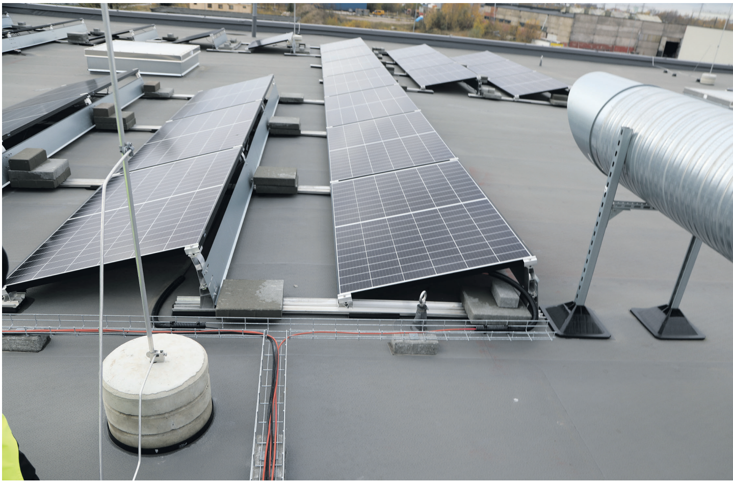
Kaablid ja juhtmed on paigaldatud vett läbilaskvatele rennidele, mis toetuvad katusele spetsiaalsetele alustele. (Eesti). Kaablirennid võiks olla pealt kaetud.

Madalama paigaldussüsteemiga katusekattele lähedal olevad päikesepaneelide lahendused hakkavad paneelide ja