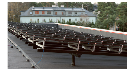
TalTech Mäemaja päikesepaneelid on paigaldatud aluskonstruktsioonidele toetuvatele pollaritele. See tekitab küll marginaalsed külmasillad, kuid võimaldab korrektset katuse hooldust. Hoonel on kõrged parapetid ja seepärast ei ole vaja ka turvavarustust.

Artikkel valmis Evri Ehitus OÜ ja Alo Karu koostöös.