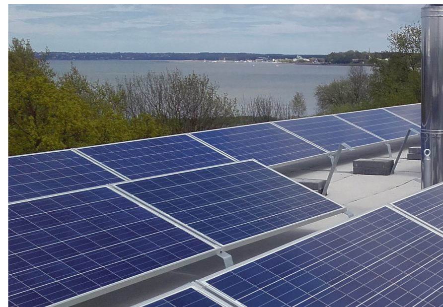
Lattrauast paneelide alus on kohati otse katusekatel. Kinnitused läbivad katusekatet. SELLINE PAIGALDUSVIIS ON KATUSEKATTELE KAHJULIK.

Turvavarustus on tootjakeskne süsteem, kus kõik komponendid on kas sama tootja omad või tema poolt aktsepteeritud. Mingit omaloomingut selle projekteerimisel ja paigaldamisel teha ei tohi. On olemas nii kukkumiskaitse kui ka turvasüsteeme. Lisaks ka selliseid, mis kinnituvad päikesepaneelide alustele. Näiteks on sellised Saksa tootjal ABS Safetyl (maaletootja Eestis OÜ Katusemaailm).