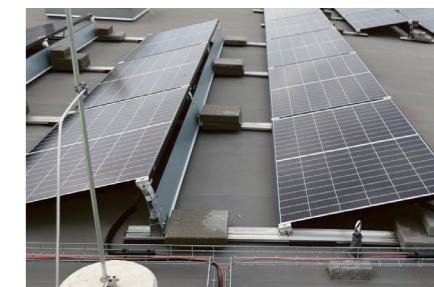
Kaablid ja juhtmed on paigaldatud vett läbilaskvatele rennidetele, mis toetuvad katusele spetsiaalsetele alustele. (Eesti). Kaablirennid võiks olla pealt kaetud.

Päikesepaneelide aluste kinnitus katusekatte külge on erilahendus. Tavaliselt lisatakse sellistes lahendustes paneelide alustele ka raskused. Seepärast tuleb arvestada katusele langevate oluliste lisakoormustega. Lisaks tuleb katusekatte kinnituse lahendus teha, arvestades päikesepaneelidest tekkivate tuulekoormusutega.