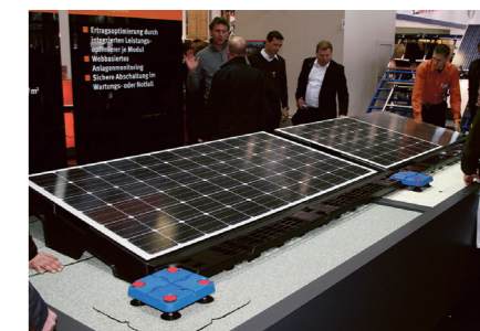
Katusekatte külge paigaldatavad päikesepaneelide alused Saksamaal. Eeldab korralikku katuse kinnituslahendust.