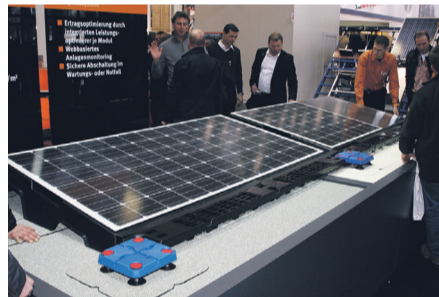
Katusekatte külge paigaldatavad päikesepaneelide alused Saksamaal. Eeldab korralikku katuse kinnituslahendust.