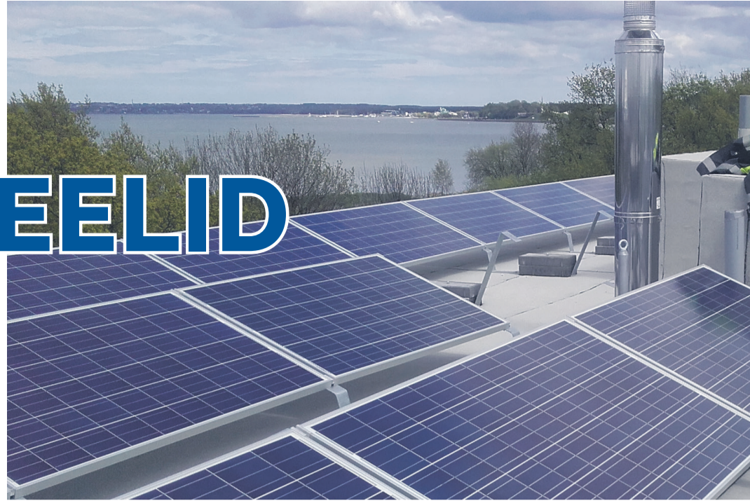
Lattrauast paneelide alus on kohati otse katusekatel. Kinnitused läbivad katusekatet. Selline paigaldusviis on katusekattele kahjulik.

Sageli ollakse olukorras, kus turvavarustus ei ole enam võimalik nõuetekohaselt paigaldada. Kogu katus on parema energiamärgise saavutamiseks otsust lõpuni päikesepaneelide täis projekteeritud ja nende vähendamine mõjutaks hoone energiamärgist. Siis ollakse dilemma ees, kas maksta lõivu energeetikale või riskida inimeste eludega. Kahjuks valitakse sageli süüdimatult viimane variant ja turvavarustus paigaldatakse, kuhu mahub, arvestamata selleks vajaliku ruumi või paigalduslahendustega, või jäetakse see hoopis ära.