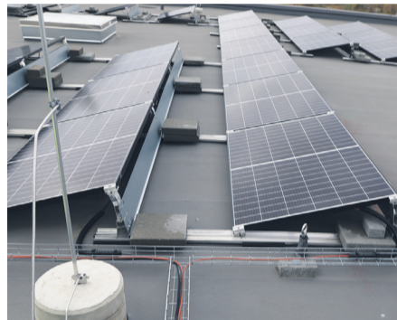
Kaablid ja juhtmed on paigaldatud vett läbilaskvatele rennidetele, mis toetuvad katusele spetsiaalsetele alustele. (Eesti). Kaablirennid võiks olla pealt kaetud.