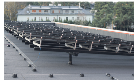
TalTech Mäemaja päikesepaneelid on paigaldatud alusstruktuuridele toetuvatele pollaritele. See tekitab küll marginaalsed külmasillad, kuid võimaldab korrektset katuse hooldust. Hoone on kõrgeid parapette ja seepärast ei ole vaja ka turvavarustust.

Kõikidel kinnitusviisidel on omad head ja vead.