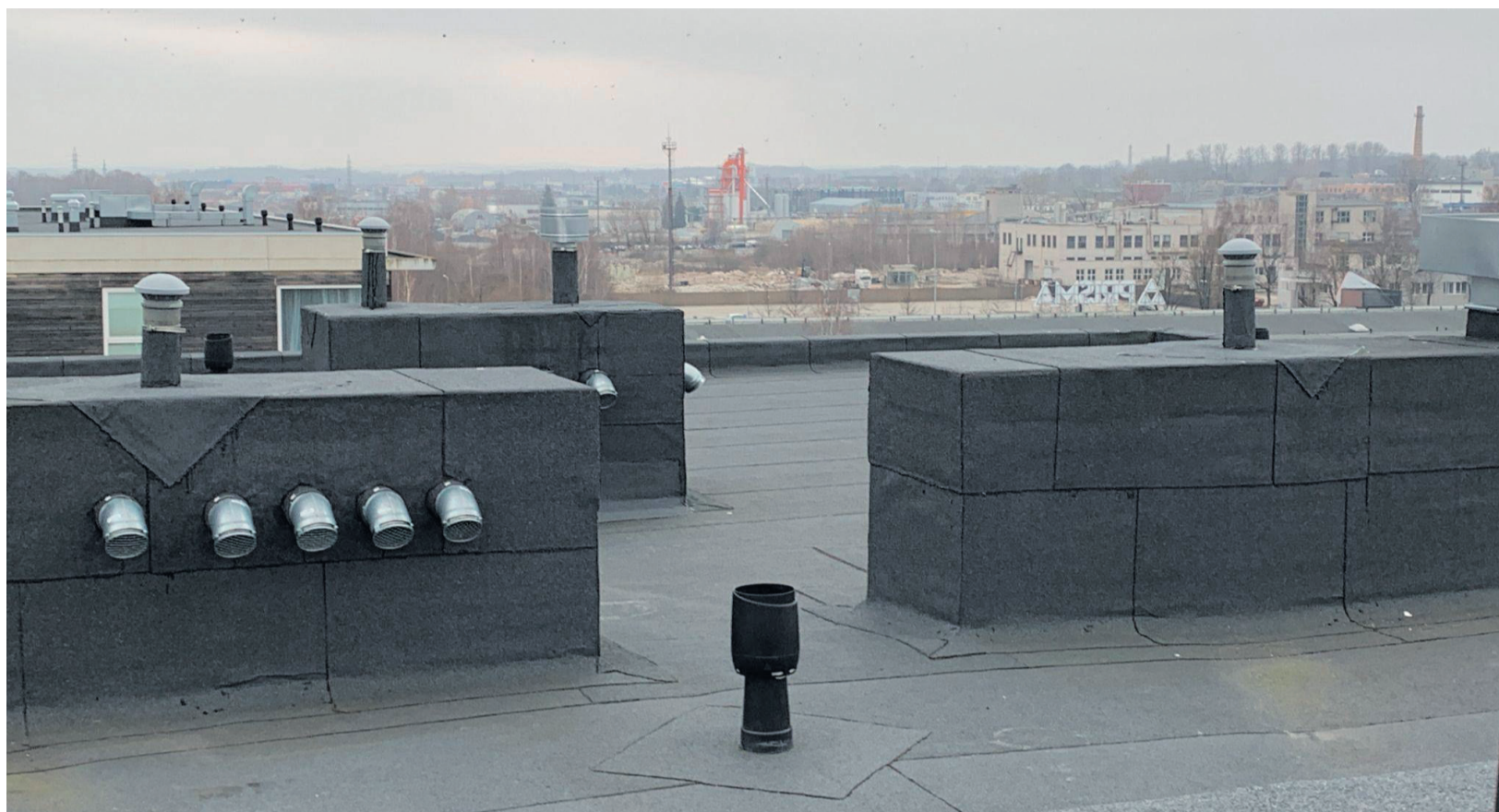
Sellise hooldatud katusega võib julgelt talvele vastu astuda.

Ummistunud katusekaev talvel. Lääbijäätmisel võib katusekaev puruneda. Tuleb veenduda, et kaevu küttegaabel on talvel sisse lülitatud.