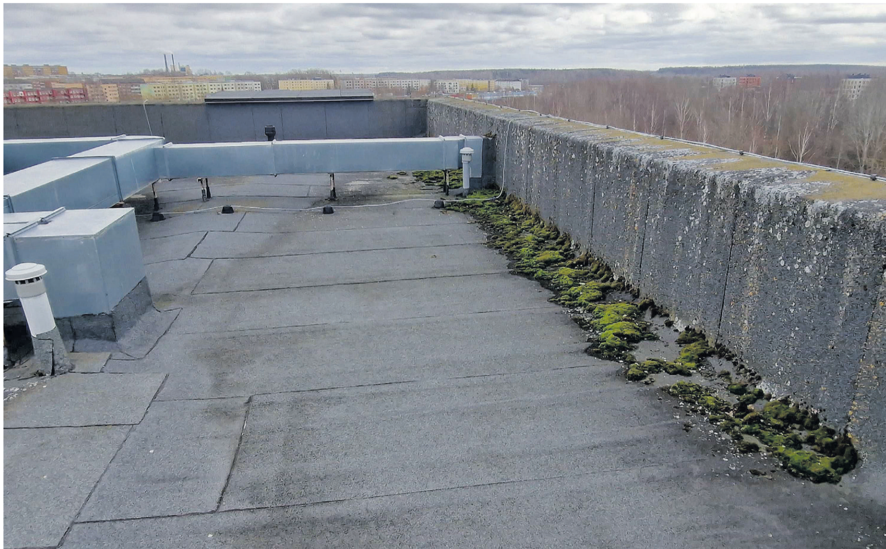
Aastaid hooldamata katusel võivad hakata kasvama sammal, puud ja muud taimed. Seejuures on oluline katusel tekkinud rohelust eemaldades olla ettevaatlik, et mitte kahjustada katusekatet.