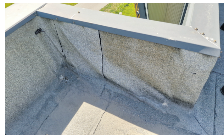
Kortsus ja halvas seisus parapeti ülespõre, mis tekitab lume sulamisel uputuse. Vajalik teostada põhjalik renoveerimine.