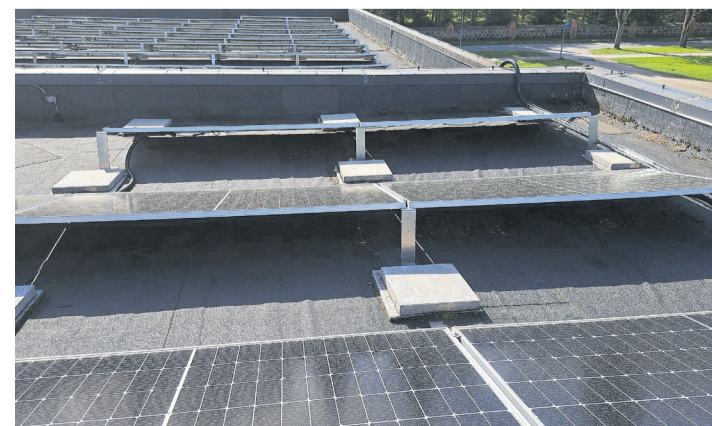
Päikesepaneelide jalad on katusekatet kahjustanud ning praht on kogunenud paneelide alla.