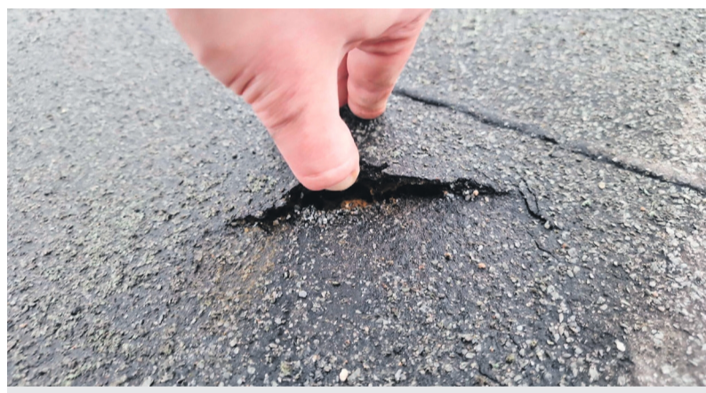
Katusel toimunud tegevuse käigus on katusekatet kahjustatud. Sellised kohad tuleb kiiremas korras paigata, et vältida suuremaid kahjustusi.