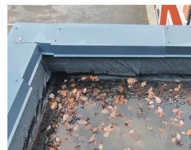
Lehed tuleb sügisel eemaldada, et vältida vee äravoolu takistamist. Antud pildil on näha, et pleki- ja rullmaterjalitööd on teostatud ebakorrektselt ning risk leketeks on suur.