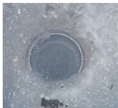
Ummistunud katusekaev talvel. Lähijäätumisel võib katusekaev puruneda. Tuleb veenduda, et kaevu küttegaabel on talvel sisse lülitatud.