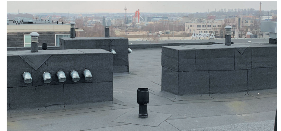
Sellise hooldatud katusega võib julgelt talvele vastu astuda.