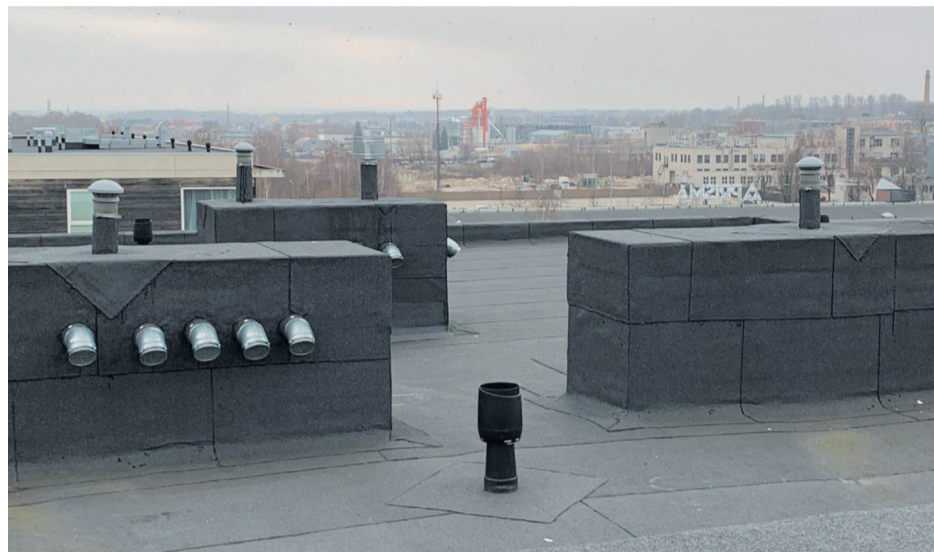
Sellise hooldatud katusega võib julgelt talvele vastu astuda.