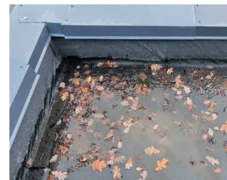
Lehed on vaja sügisel eemaldada, et vältida vee äravoolu takistamist. Sel pildil on näha, et pleki- ja rullmaterjalitööd on tehtud ebakorrektselt ning risk leketeks on suur.

prahi koristamisel tuleb kasutada pehmet harja ning teravaservalised esemed korjata üles käsitsi. Samuti on oluline mitte lasta katusel olevat prahhi vihmavee äravoolutorudesse.