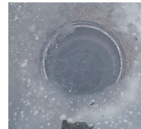
Ummistunud katusekaev talvel. Lähijäätumisel võib katusekaev puruneda. Tuleb veenduda, et kaevu kütdekaabel on talvel sisse lülitatud.

Ole lume- ja jääkoristusel ettevaatlik – liigne jõud võib kahjustada katusekatet ja kõrgustes töö tegemine olla teadmatus tegutsemisel ohtlik. Kui sa pole kindel, kuidas eemaldada lund katust kahjustamata, kutsu appi spetsialistid.