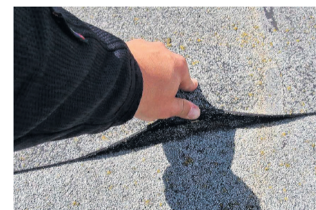
Ebakorrekse paigalduse tõttu lahti tulnud rullmaterjal – kogu katus tuleb uue kihiga katta.