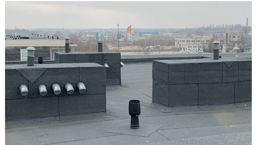
Sellise hooldatud katusega võib julgelt talvele vastu astuda.

Enne külmade ilmade saabumist tuleb katus talveks ette valmistada. ► Puhasta katuse vihmaveelehtrid, -rennid ja -torud puulehtedest ning prahist, et tagada katusele vee vaba äravool. Seejuures on oluline pidada silmas, et