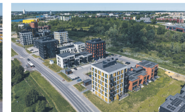
Kortermajad Tartus Ihaste põigus.

• Finantsiline stabiilsus Veenduge, et ettevõtte poleks maksuvõlgu ega likviidsusprobleeme. Stabiilne firma suudab osta kvaliteetseid materjale ja täita oma garantiikohustusi ka aastate pärast. • Pakkumise detailsus Korrektne pakkumine ei ole üherealine summa. See peab sisaldama lahti kirjutatud materjalide mahte, tööde loetelu ja täpseid tehnilisi lahendusi (nt soojustuse paksus, kattekihtide arv). • Garantiitingimused Uurige, kui pikk on garantiiperiood ja mis kuulub garantii alla. On oluline pidada silmas, et odavamate pakkumuste puhul võib sääst tulla vähem kvaliteetsete materjalide, ebakvaliteetse töö ja maksudega trikitamise arvelt. Kauem turul tegutsenud ettevõtte ei saa sellise mainekahjuga riskida.