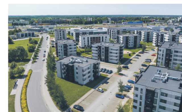
Kortermajad Tartus Haki ja Haraka tänavas.

MILLES VEENDUDA? • Erialaekspertis ja kogemus Eelistage partnerit, kel on pikaajaline kogemus sarnaste mastaapidega projektidega. Tehtud töid saab tõsiseltvõetavate ettevõtete puhul üldjuhul kontrollida nende kodulehelt. OÜ Evari Ehitus tehtud töödega saab tutvuda aadressil https://evari.ee/tehtud-tood/ .