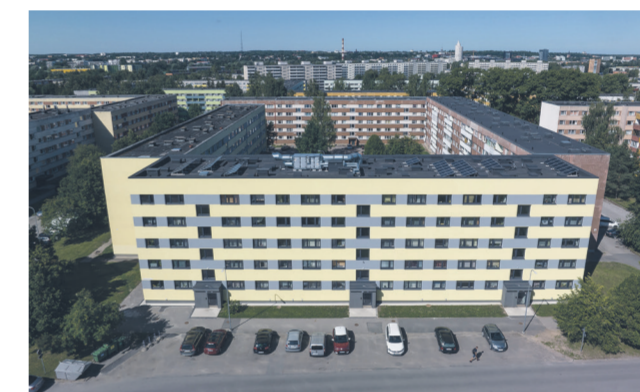
Kortermajad Tartus Kaunase piisteel.