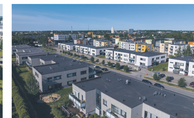
Kortermajad Tartus Ladva tänavas.