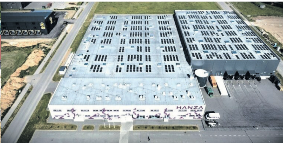
Lamekatustele paigaldatakse üha rohkem päikesepaneele, kliimaseadmeid, ventilatsiooniseadmeid, antenni, reklaame, et muuta hooned energiatõhusamaks, mugavamaks, funktsionaalsemaks.