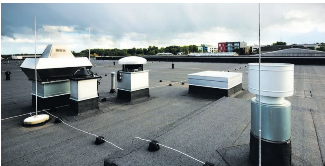
Läbiviik on koht, kus katuse kaudu viiakse läbi kaabel, toru, ventilatsioon, antenn, kliimaseade või muu seade, mis vajab ühendust hoone sisemuse ja välise keskkonna vahel.