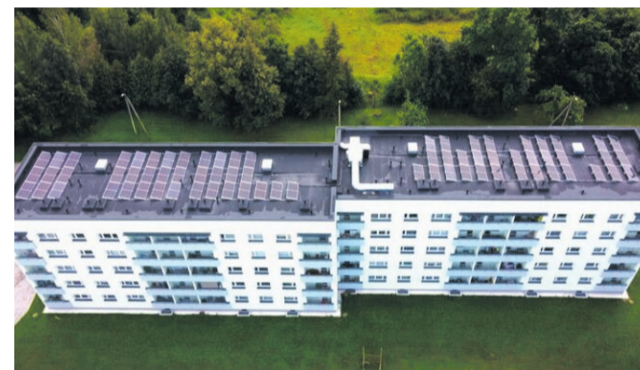
OÜ Evari Ehitus on üle 30 aasta kogemust lamekatuste ehitamisel ja hooldamisel. Pakume terviklahendusi, et päikesepaneelide ja teiste seadmete paigaldus katusele toimiks professionaalselt.

Garantii kehtetuks muutumine. Valesti tehtud läbiviigud võivad ikkuda katusegarantii tingimusi. Vale läbiviik võib hakata vett sisse laskma ja kahjustada katuse