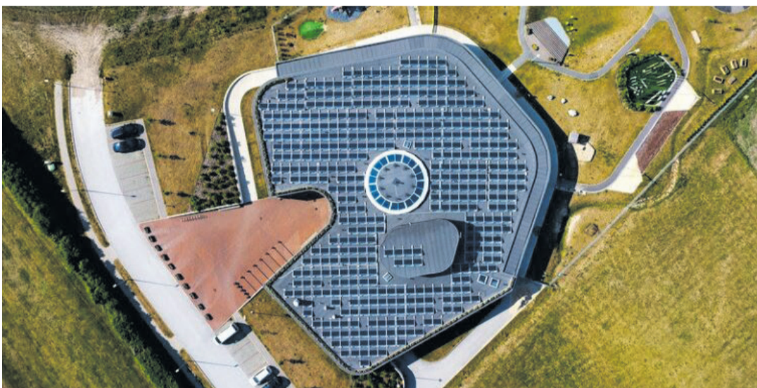
Enne seadmete paigaldamist lamekatusele tasub hinnata katuse üldist seisukorda ja valmisolekut.

Veekahjustusi ja lekkeid. Vale läbiviik võib hakata vett sisse laskma ja kahjustada katuse konstruktsiooni ning soojustuskihti.